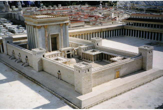
Ибадәтханиның оттурисидики муқәддәсхана (Израилйә Йерусалимдики музейи)